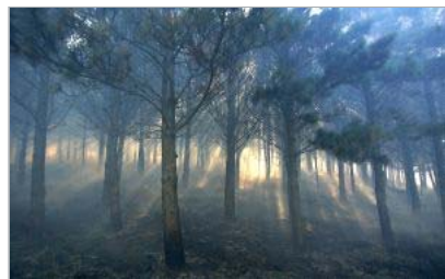
COSTA DA MORTE. Un bosque abrasado por el fuego en Pesqueira, cerca de Camariñas.

En Pontevedra, volvieron a avivarse por la mañana los incendios de Moaña, Pontecaldelas y A Estrada. El fuego que ha arrasado Sotomaior iba a menos, más que nada porque ya no quedaba nada que lo alimentase: se ha quemado la mitad del municipio y el 80% de su masa forestal. En los alrededores de Baiona, los ganaderos buscaban sus reses por los montes y daban con cadáveres abrasados de animales y con bestias aterradas que vagaban por cumbres y laderas, expulsadas por las llamas de sus pastos. Al parecer, los signos del desastre alcanzaron Madrid: una gran nube de humo oscureció a primera hora de la tarde el cielo del norte de la comunidad, acompañada de un fuerte olor a quemado, y los expertos del Instituto Nacional de Meteorología (INM) apuntaron como principal hipótesis que podía proceder de los bosques gallegos.