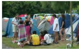
Además de en la playa, la DYA ha estado atendiendo a los usuarios y bañistas del camping.