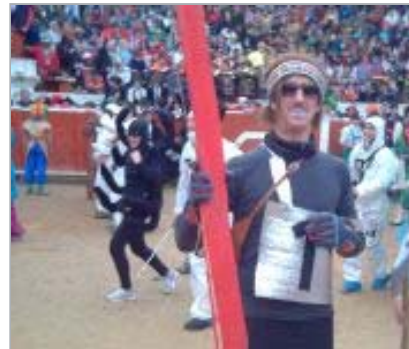
Iturzaeta, en la plaza de toros, el lunes de Carnaval. [JUANMA GOÑI]

- No podemos seguir sustentando toda la estructura organizativa del Carnaval sobre un técnico de fiestas, los agentes de la Udaltzaingoa y los voluntarios de la DYA. Con esta estructura organizativa no podemos llegar a resolver todos los problemas que genera la dimensión de «fiesta grande» del Carnaval tolosarra. Los Iñauteriak han crecido mucho y tenemos que saber adaptarnos.