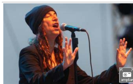
La cantante Patti Smith durante el concierto en San Sebastián.

Un tímido "probando, probando" y una serie de golpes de bombo y platillo destacaban a primera hora de la mañana en la playa de la Zurriola, prácticamente desierta. Sobre la arena mojada, un grupo de jóvenes desenrollaba el entresijo de cables que debían unir con el Escenario Verde. En varias carpas se empezaban a rellenar los barriles de cerveza y las vallas se colocaban estratégicamente para amortiguar a las 25.000 personas que se calcula habrá en el concierto de Patti Smith. Y es que, como afirmaba Denis Itxaso, concejal de Cultura del Ayuntamiento de San Sebastián, "hay ganas de que la música empiece a sonar".