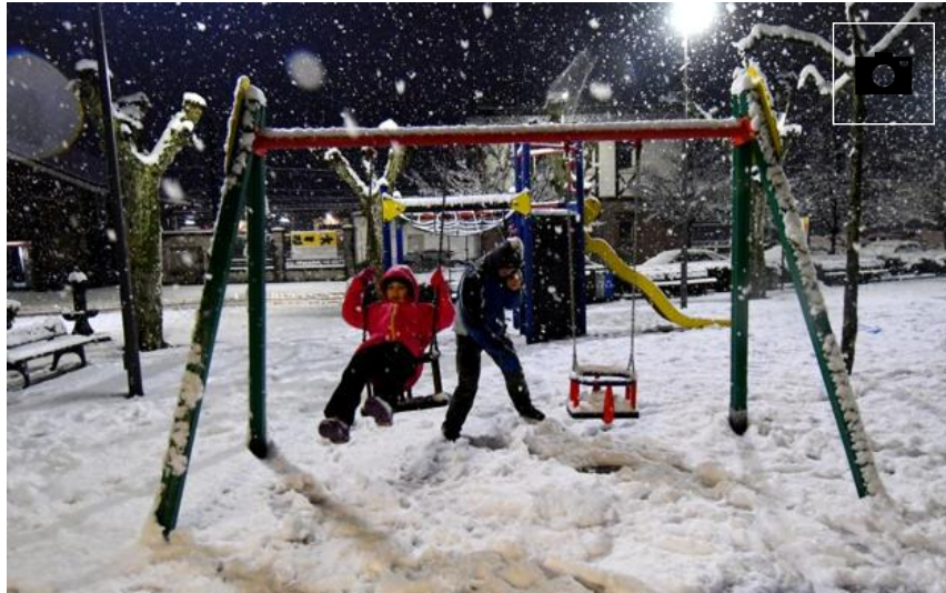
Galería. Intensa nevada en Berastegi.

copiosamente a lo largo de la jorana y las carreteras han quedado cubiertas con un manto blanco y desde el Departamento Vasco de Seguridad piden precaución a la hora de circular.