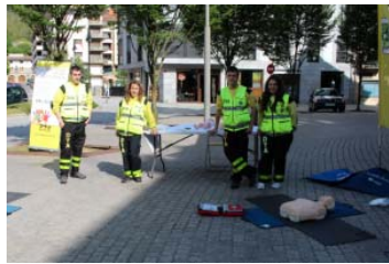
( http://urolakosta.hitza.eus/site/files/2018/01/DYA.png )

Urola Kostako Hitza ( https://urolakosta.hitza.eus/sinadurak/urola-kostako-hitza/ )