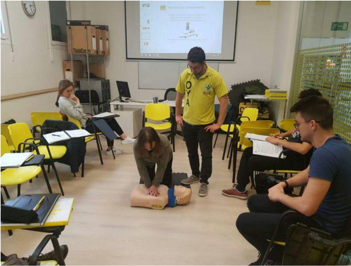
Imagen de un curso de primeros auxilios.

Personal de la DYA organiza el encuentro que tendrá lugar mañana en la sociedad Urtoki