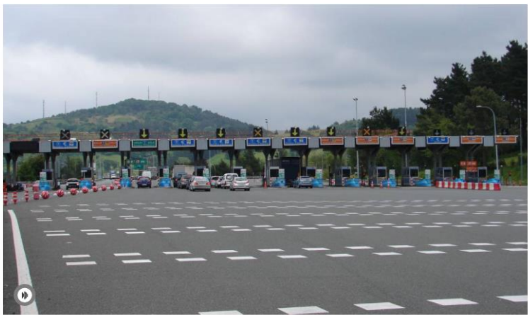
Diputación Foral de Gipuzkoa

Por la previsión meteorológica y en vista a las retenciones en la frontera hay 4.000 litros de agua de avituallamiento