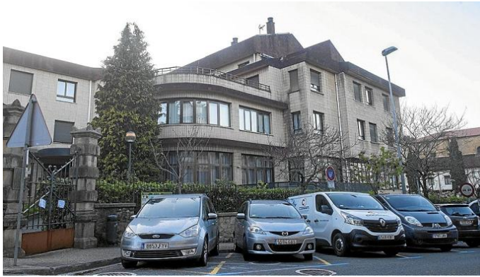
Exterior de la residencia Santa Ana de Zarautz, en la que ayer fallecieron tres usuarios.

IRAITZ ASTARLOA / RUBEN PLAZA | 04.04.2020 | 01:26