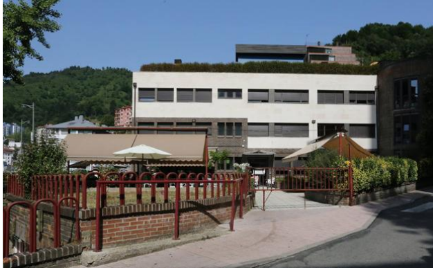
Imagen de la residencia San Andrés de Eibar.

Se ha registrado un nuevo caso de contagio por Covid-19