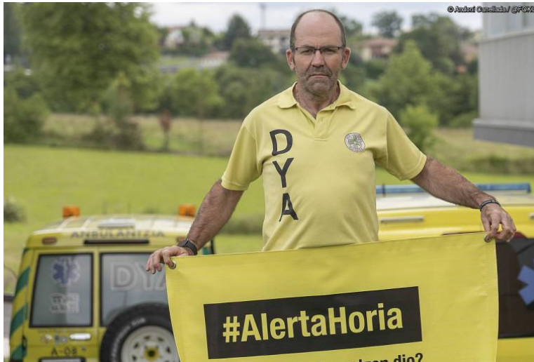
"PANDEMIK ZULOA UTZI DIGU, ETA ESTALTZEA ESPERO DUGU"