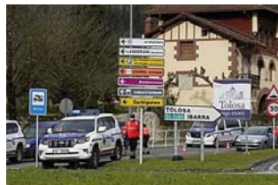
Euskadi decide hoy blindarse en situación de alerta máxima de