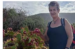
Un final trágico para una vida difícil