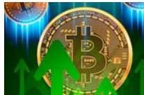
Invertir en Bitcoin: aspectos a considerar antes de comprar...