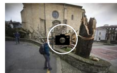
Aviso amarillo fuertes rachas de viento