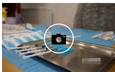
Vacunados una veintena de profesionales del centro de día Nuestra Señora de las Mercedes