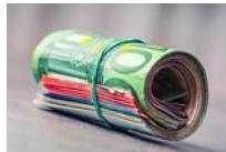
Invirtiendo 250€ en acciones de Amazon podrías conseguir un...