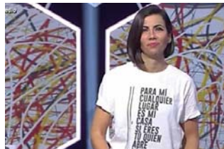
Locura por esta camiseta de Ana Pastor: se colapsa la web donde la venden