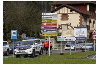
Euskadi decide hoy blindarse en situación de alerta máxima de contagios