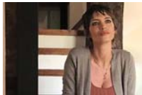
Sara Carbonero, operada de urgencia en una clínica de Madrid