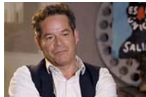
La confesión de Jorge Sanz: «Antonio Resines y Santiago Segura me llevan manteniendo dos años»