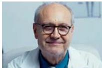
Próstata: Un experto español revela un simple truco para...