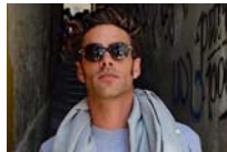
El desnudo más artístico de Jon Kortajarena