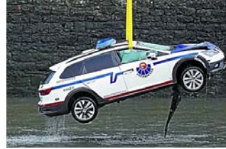
¿Qué pasó en el Urumea?