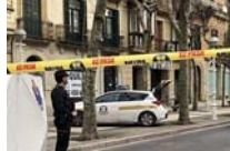
Solicitan testigos del accidente mortal en el centro de Donostia DIARIOVASCO