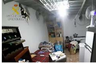
Liberan a una mujer secuestrada durante un año en el garaje de una vivienda