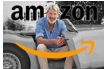
¡Es por esto que invertir 250 euros en Amazon y otras acciones puede... La revista de la riqueza | patrocinado