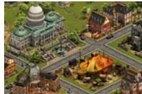
Este juego de moda es adictivo. No instalación Forge Of Empires | patrocinado