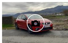
Gama Seat Ibiza