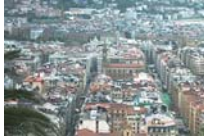
Los barrios más exclusivos para vivir en Donostia-San Sebastián DIARIOVASCO