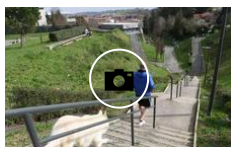
Parques y jardines de Irun