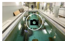
Los tesoros de Gordailua