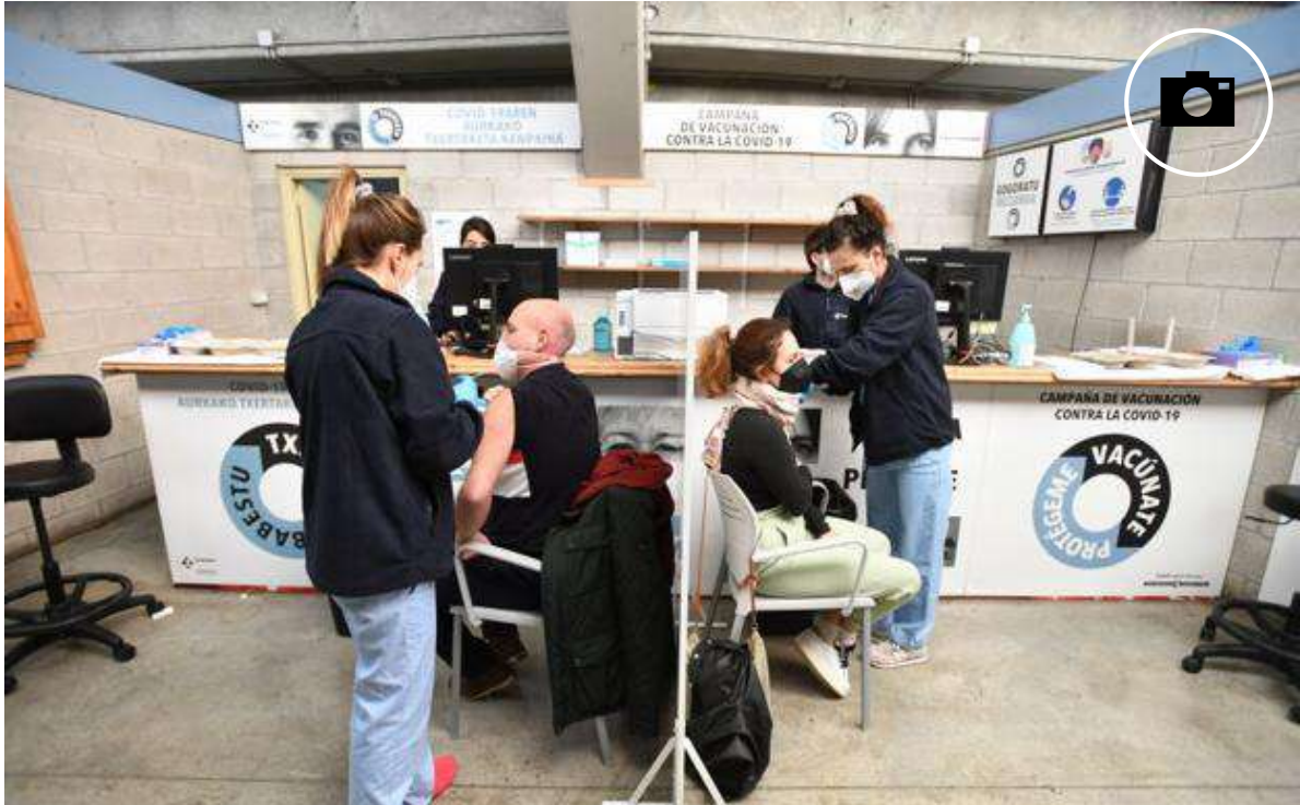
📷 Galería. Dos personas son vacunadas.